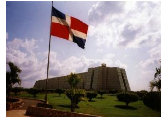
EL FARO A COLÓN

Estamos certificados por la Superintendencia de Bancos de la República Dominicana y por la Cámara de Cuentas de la República Dominicana y somos miembro activo del Instituto de Contadores Públicos Autorizados de la República Dominicana, la Asociación de Firmas de Contadores Públicos Autorizados, la Cámara Americana de Comercio, la Cámara Británica de Comercio y la Cámara Domínico Haitiana.