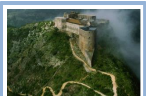
CIUDADELA DE LAFERRIÈRE, HAITI

HLB International es una red mundial de firmas independientes de contadores públicos, que provee a sus clientes servicios de auditoría, impuestos, contabilidad y asesoría de negocios.